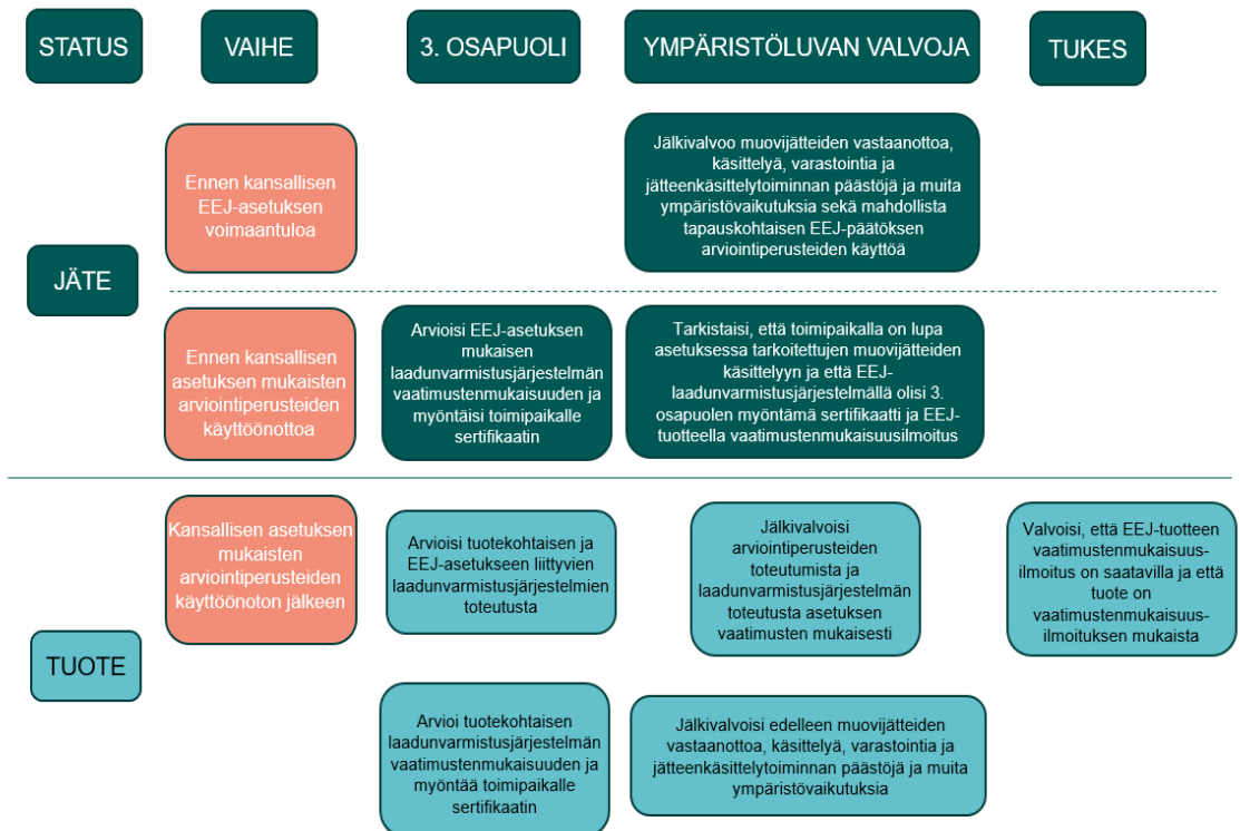
Kuva 2. Ympäristönsuojeluviranomaisen, Turvallisuus- ja kemikaaliviraston (TUKES) ja laadunvarmistusjärjestelmän vaatimustenmukaisuuden arvioivan kolmannen osapuolen tehtävänjako kansallisen EEJ-menettelyn soveltamisen eri vaiheissa ja tuote-jäte -rajapinnalla.

Ympäristönsuojeluviranomaisella olisi myös asetukseen liittyviä jälkivalvonnallisia tehtäviä (Kuva 1). Ympäristönsuojeluviranomainen tarkistaisi, että