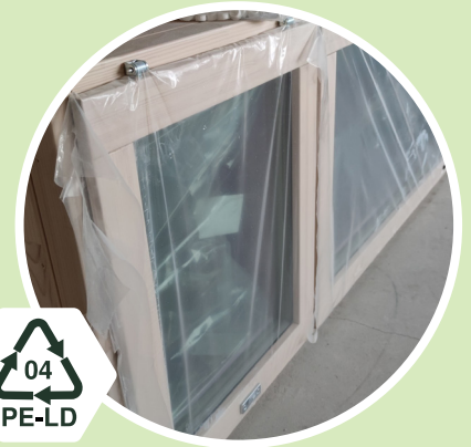
Ikkunat ja ovet Kirkas pakkausmuovi 04 - PE-LD Polyeteeni low-density