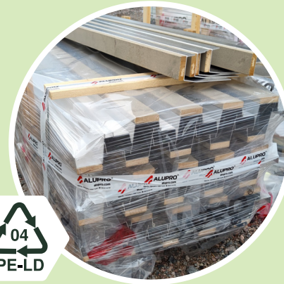
Julkisivu- ja kattomateriaalit Kirkas pakkausmuovi 04 - PE-LD Polyeteeni low-density