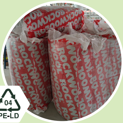
Villat Värillinen pakkausmuovi 04 - PE-LD Polyeteeni low-density