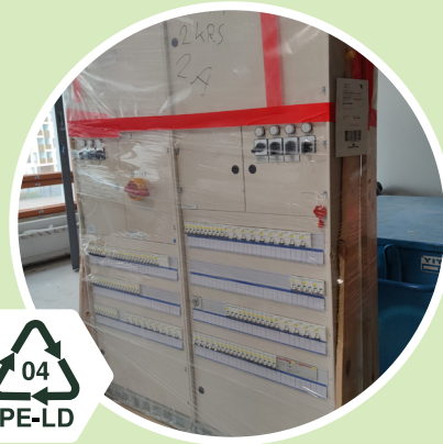
Laitteet ja kalusteet Kirkas pakkausmuovi 04 - PE-LD Polyeteeni low-density