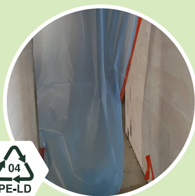
Pölysuojat Kirkas tai värillinen kalvomuovi 04 - PE-LD Polyeteeni low-density