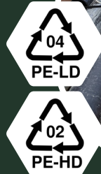
Muoviset putket ja putkien osat Esim. 04 - PE-LD Polyeteeni low-density 02 - PE-HD Polyeteeni high-density