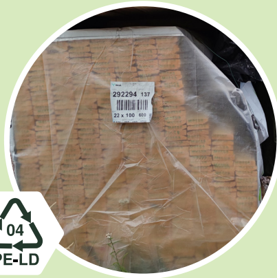
Puutavarat Kirkas ja Värillinen suojahoppu 04 - PE-LD Polyeteeni low-density