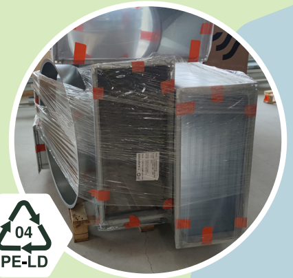
Putki-, IV- ja sähkömateriaalit Kirkas pakkausmuovi 04 - PE-LD Polyeteeni low-density