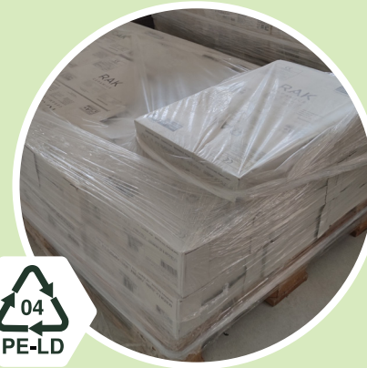
Lattiamateriaalit Kirkas pakkausmuovi 04 - PE-LD Polyeteeni low-density