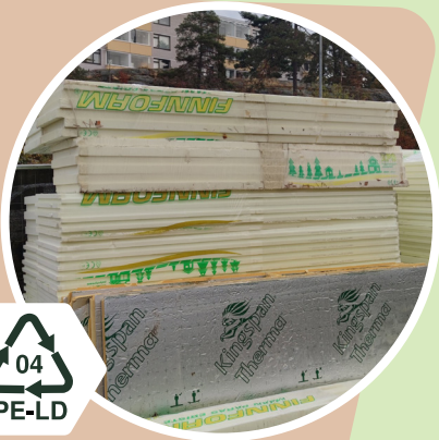
Eristelevyt Kirkas pakkausmuovi 04 - PE-LD Polyeteeni low-density