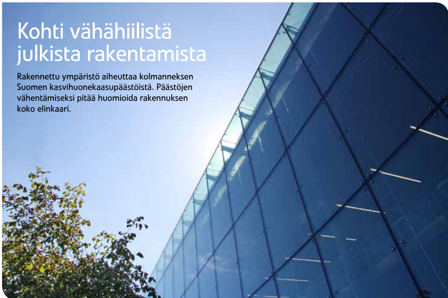
Kuva ja grafiikka: Matti Kuitinen

Rakennettu ympäristö aiheuttaa kolmanneksen Suomen kasvihuonekaasupäästöistä. Päästöjen vähentämiseksi pitää huomioida rakennuksen koko elinkaari.