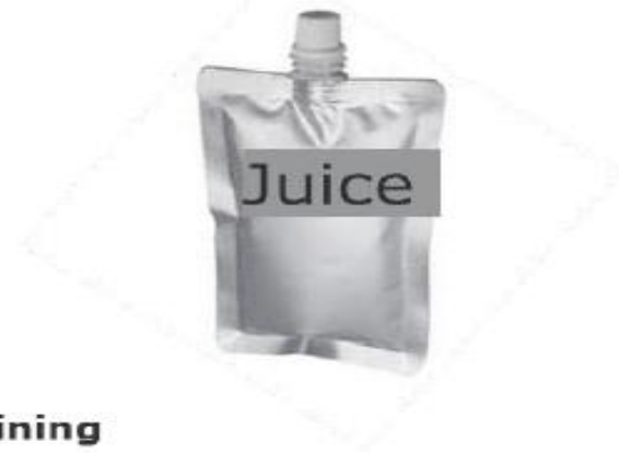
Plastic multilayer pouch containing juice (150 ml)