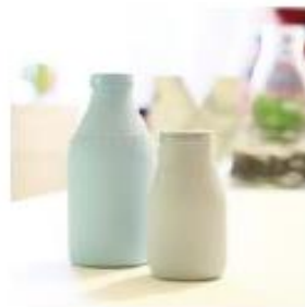
Plastic container containing drinkable yogurt (150 ml)