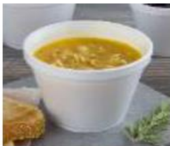
Plastic container containing single-sized portion noodle soup (100g)