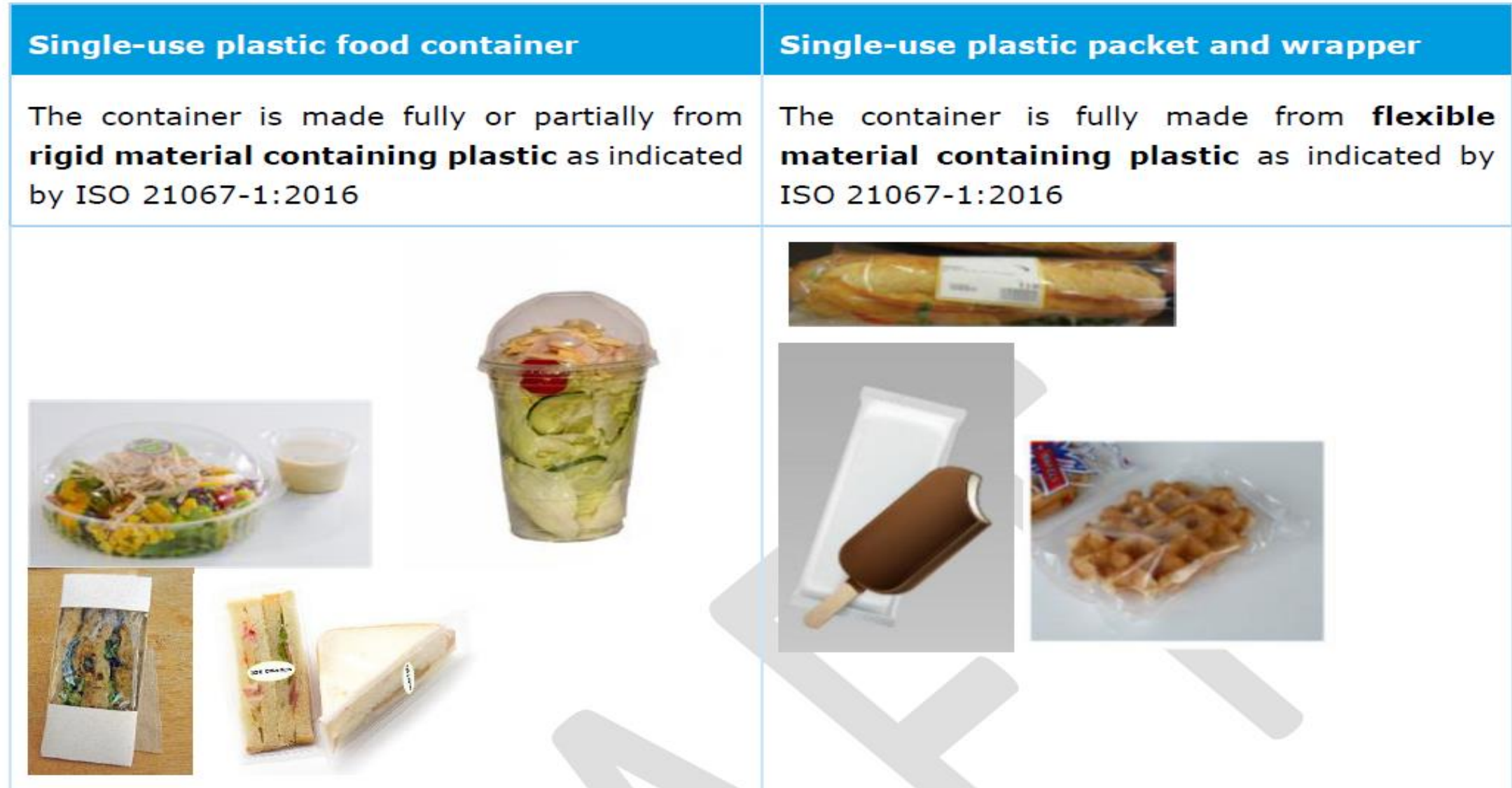
Table 1-5: Illustrative examples of differentiation between single-use plastic food containers and packets and wrappers