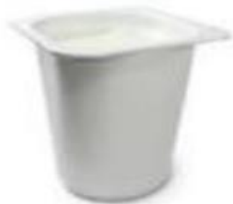
Plastic container containing yogurt (100g)