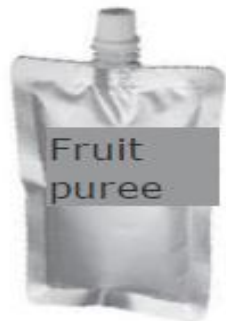
Plastic multilayer pouch containing fruit puree (150 ml)