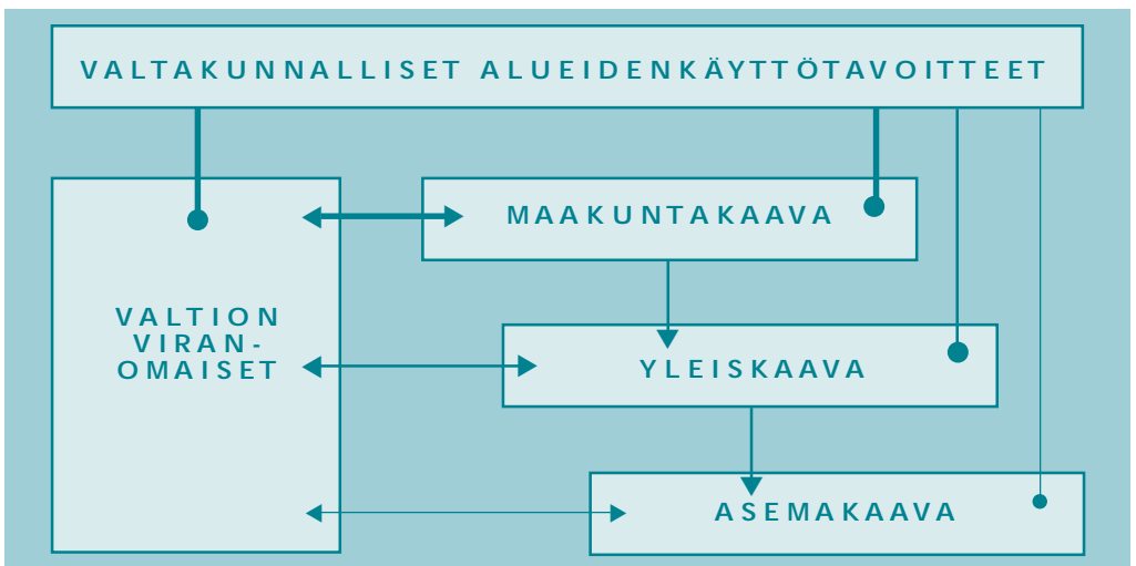
Kuva 2.1: Valtakunnallisten alueidenkäyttötavoitteiden toteuttaminen.

Velvoite valtakunnallisten alueidenkäyttötavoitteiden toteuttamisesta ja huomioon ottamisesta koskee siis toisaalta valtion viranomaisten toimintaa ja toisaalta maakunnan suunnittelua ja muuta alueidenkäytön suunnittelua eli yleis- ja asemakaavoitusta. (kuva 2.1).