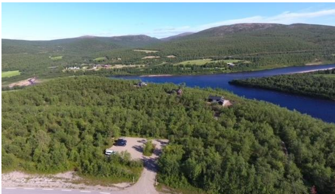
Figur 3. Dronebilde som viser planområdet sett fra E6 med Tanaelva og Finland i bakgrunnen.

Langs bekker vokser det frodig buskvegetasjon, og det renner en slik bekk like nord for planområdet.