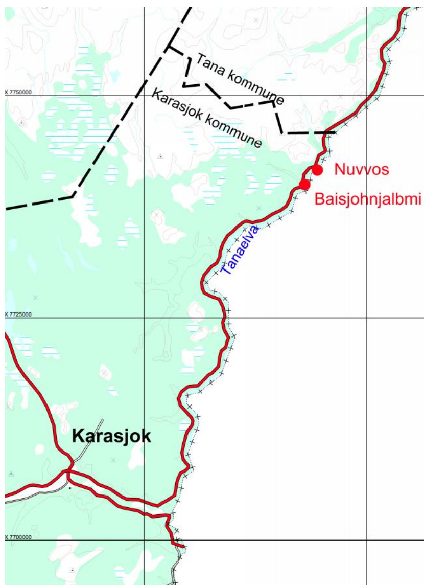
Figur 1. Oversiktskart.

Planområdet er lokalisert på vestsiden av Tanaelva, ca. 62 km fra Karasjok sentrum mot Tana etter E6. Det vises til oversiktskart på figur 1.